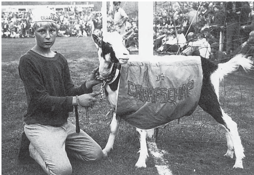
In de jaren zestig had De Graafschap een tijd een bok als mascotte. Volgens Guus Hiddink was het 'Achterhoeks' om 'bokkig' te zijn

Zoals dat bij volksclubs als NEC werd verkondigd, zo had de uitgedragen clubcultuur volgens velen ook bij De Graafschap haar neerslag op het veld. Het eerdergenoemde clublied bevat de boodschap: 'As 't effen niet lup geven wi-j nog gas d'r bi-j (...) streupt de mouwen op.' Soms wordt dan ook gezegd: 'De Graafschap staat voor strijd.' 75 Historisch gezien lijkt de speelstijl desalniettemin vaak te zijn veranderd. Eind jaren zestig was op de Vijverberg bijvoorbeeld 'technisch en lichtvoetig spel' en 'raffinement' te zien van 'superlichte, tikkende spelers'. 76 En hoewel in het verleden soms werd geklaagd dat De Graafschap 'onstuimig' speelde, 77 was het team lang niet altijd zo hard: zo moest trainer Piet de Visser zijn elftal in 1973 vragen er wat steviger in te gaan, omdat het er in de Eredivisie nu eenmaal 'niet zo lief' aan toeging. 78