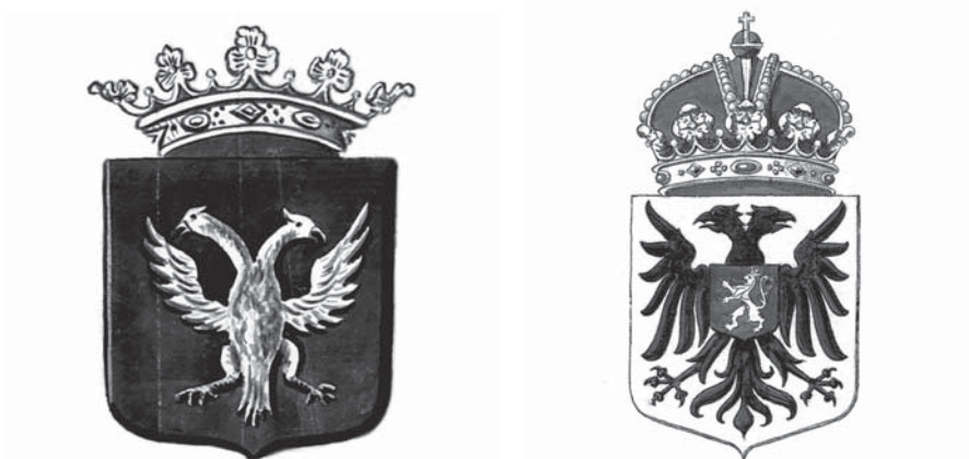
Boven de stadswapens van Arnhem en Nijmegen, onder de clublogo's van Vitesse en NEC