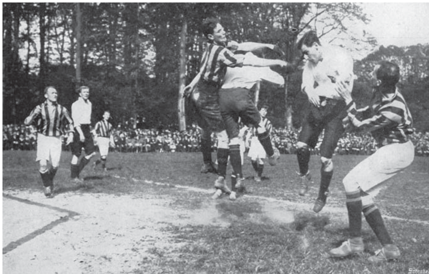
Nooit kwam Vitesse dichterbij het landskampioenschap dan in 1914. Te Arnhem werd het Haagse HVV met 4-1 verslagen, maar de beslissingswedstrijd tegen hetzelfde HVV ging later verloren. Hier is een beeld te zien uit de thuiswedstrijd ( De Revue der Sporten , 5 mei 1914 (nr. 51) 811)

zijt opgewassen!’ 15 Wedstrijden tussen de districtselftallen Oost-Nederland en West-Nederland vergrootten nog eens de zichtbaarheid van de bestaande strijd. Maar ook bij deze wedstrijden stonden volgens de Provinciale Geldersche en Nijmeegsche Courant (PGNC) de voetballers ‘uit den achterhoek’ – wat hier heel het Oosten betekende – op het tweede plan. 16