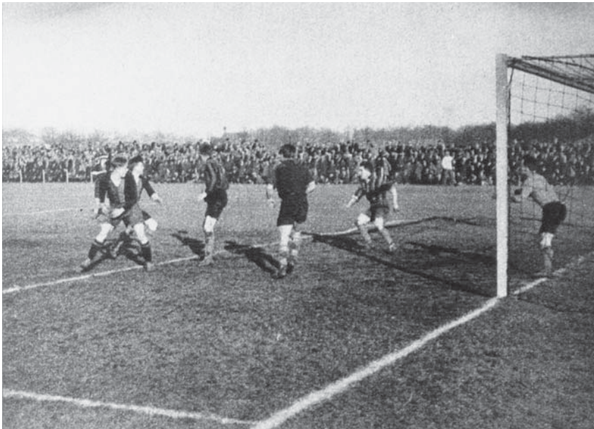
Ook binnen de stad vonden natuurlijk felle ontmoetingen plaats. Wedstrijden tussen NEC en Quick werden tot na de Tweede Wereldoorlog gezien als duels om de eer van Nijmegen. De afgebeelde editie (9 februari 1930) eindigde in 2-3 voor Quick (Regionaal Archief Nijmegen, Fotocollectie, F53154, 14 februari 1930; fotograaf onbekend)

neergang van den derden stand en de opgang van den vierden stand. De arbeider haalt hier den burger-sportman in en laat hem niet meer bijkomen.’ 37