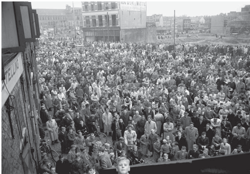
Op deze foto uit 1950 staan Nijmegenaren aandachtig te luisteren naar een radioverslag van Vitesse-Quick. De Arnhemse club promoveerde ten koste van Quick, waardoor dit de laatste competitieve editie was van de gewaardeerde derby. NEC werd nu de vertegenwoordiger van Nijmegen